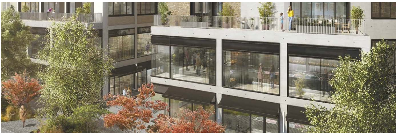
GRENNELLE - PARIS 7 Vente de 40 lots - 3 300 m 2

We have several dedicated teams in our sales offices, as well as teams specifically focused on recommendations thanks to our sales platform www.catellapatrimoine.com . With the help of our back office team and our sales follow-up, we ensure that our clients receive a service that is tailored to their needs.