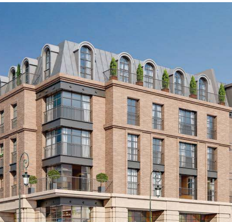
RUE VOLTAIRE - PUTEAUX (92) Vente de 150 appartements

The appeal of new residential properties is increasing as evidenced by the unprecedented volume of such properties transacted. A secure yield, almost non-existent vacancy rate and long-term added value are the three fundamentals of this asset category.