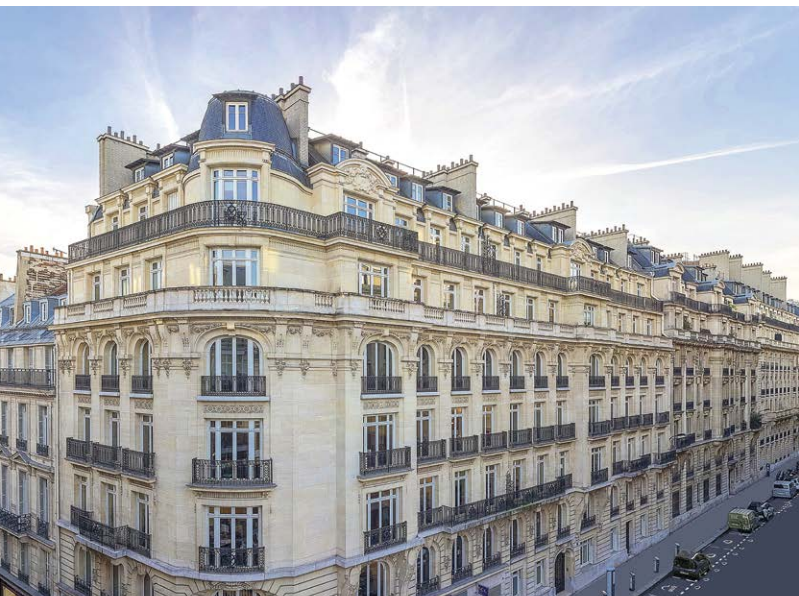
1 - 3 - 5 RUE JULES LEFEBVRE - PARIS 9 Vente en bloc - 10 000 m 2