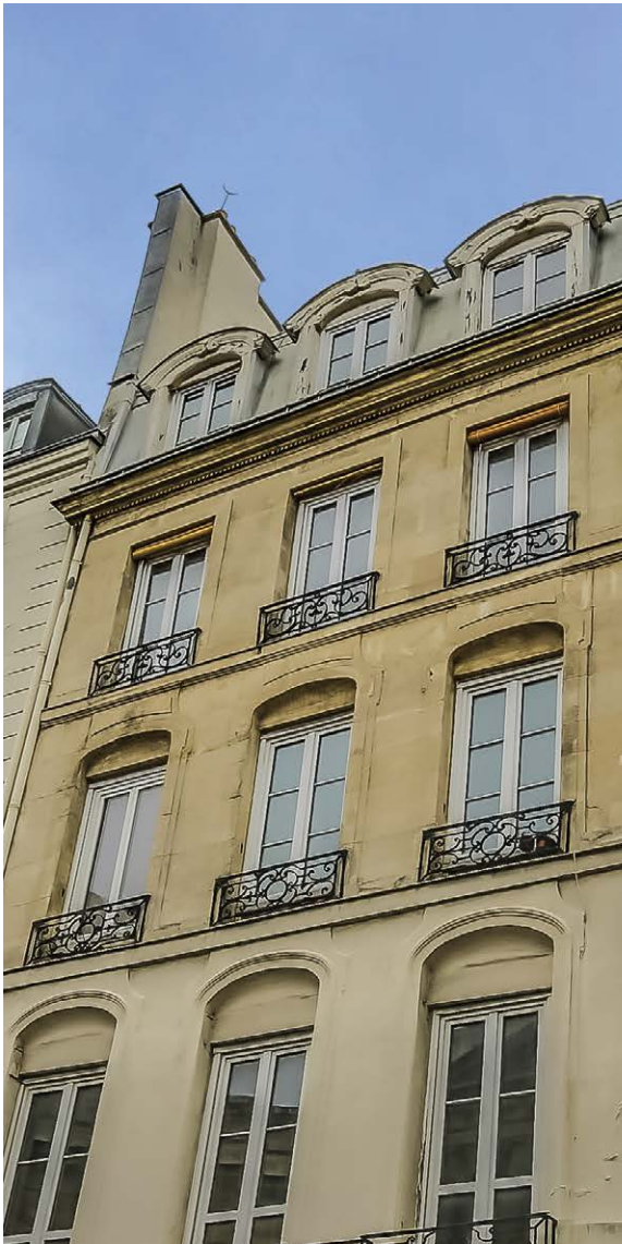
RASPAIL - BAC - GRENNELLE - PARIS 7 Vente de 29 lots - 1 237 m 2