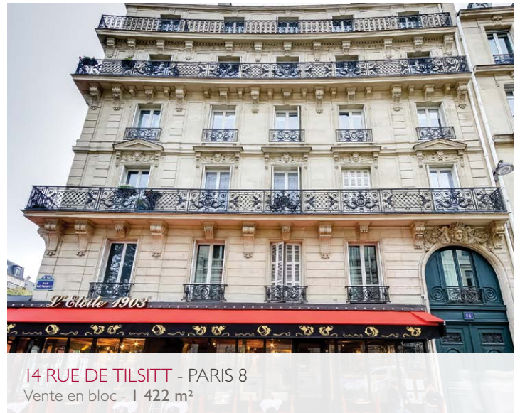
14 RUE DE TILSITT - PARIS 8 Vente en bloc - 1 422 m 2

Our team will advise these groups in terms of strategy development for sales or acquisitions, and will support them through each step of the process until the transaction has been finalised.