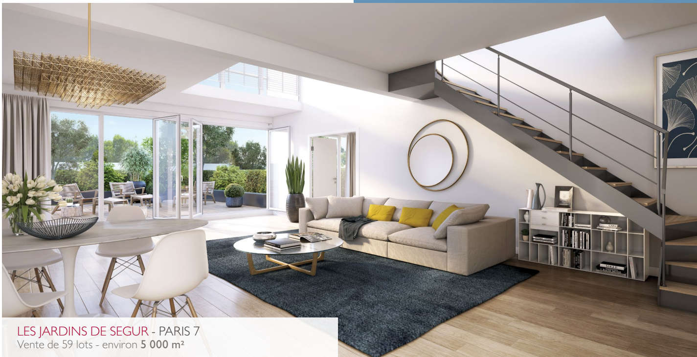
LES JARDINS DE SEGUR - PARIS 7 Vente de 59 lots - environ 5 000 m 2