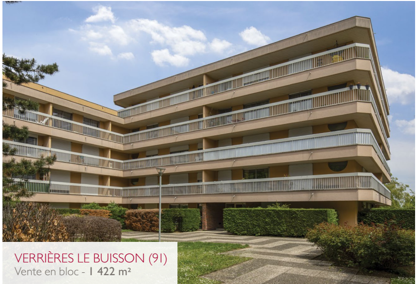
VERRIÈRES LE BUISSON (91) Vente en bloc - 1 422 m 2

Our team will advise these groups in terms of strategy development for sales or acquisitions, and will support them through each step of the process until the transaction has been finalised.