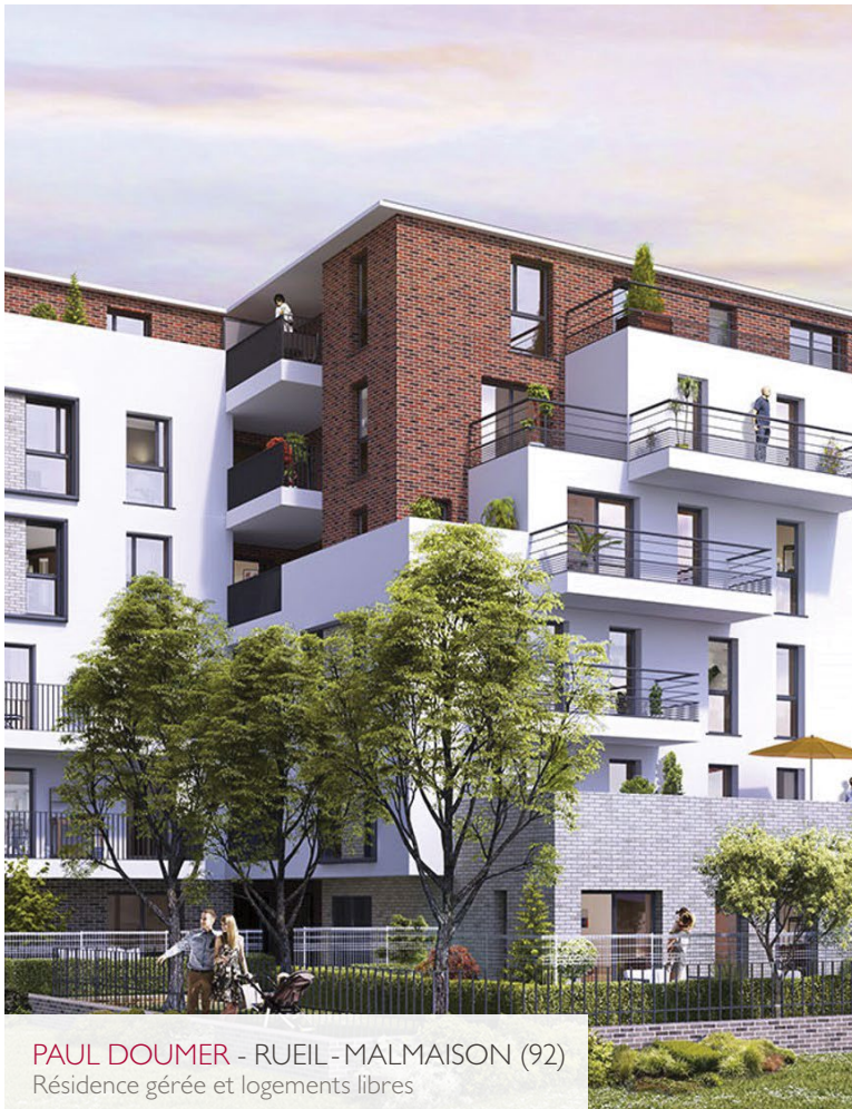
PAUL DOUMER - RUEIL-MALMAISON (92) Résidence gérée et logements libres