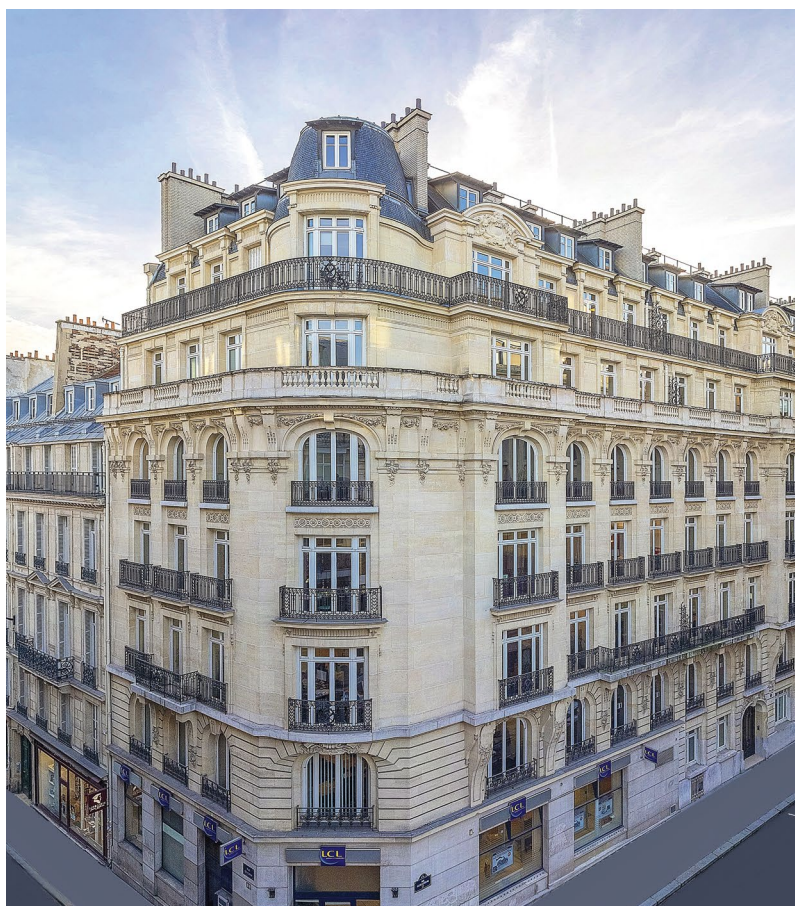
1 - 3 - 5 RUE JULES LEFEBVRE - PARIS 9 Vente en bloc - 10 000 m 2