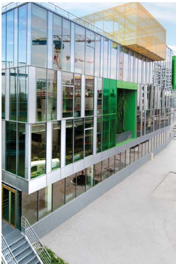
IRISIUM - LILLE Vente de 9 500 m 2 de bureaux de DEKA à LA FRANCAISE