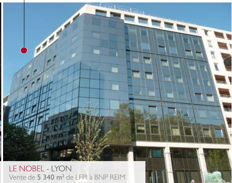
LE NOBEL - LYON