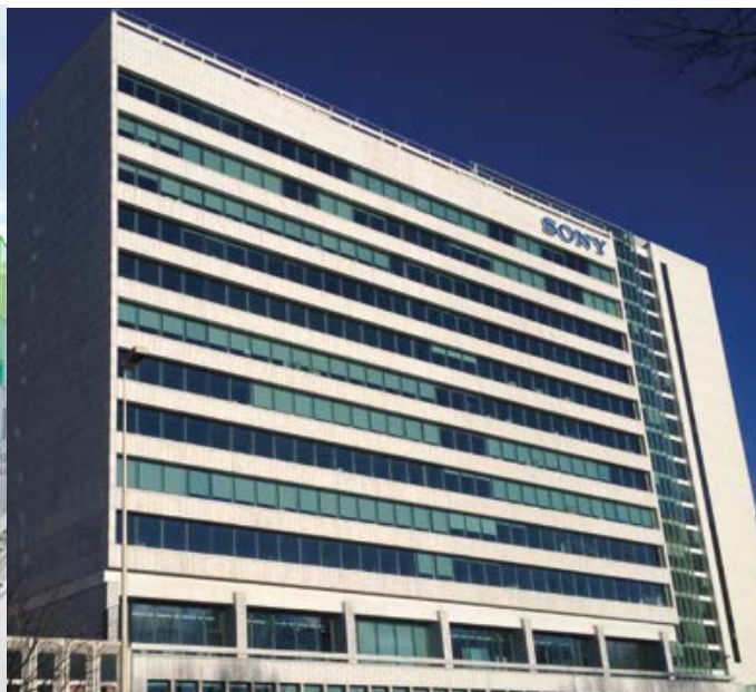
AVISO - PUTEAUX Acquisition off market de 11 000 m 2 de bureaux par LA FRANCAISE REM à WEINBERG CAPITAL PARTNERS