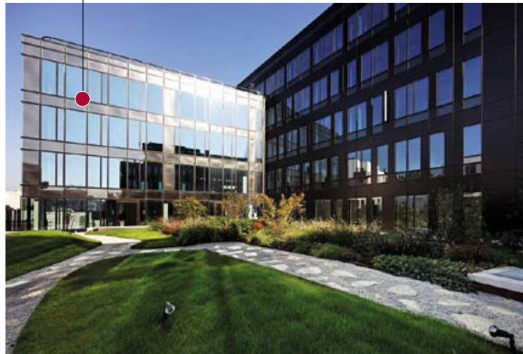
POINTE MÉTRO - GENNEVILLIERS Vente de 23 700 m 2 de HINES à NORTHWOOD