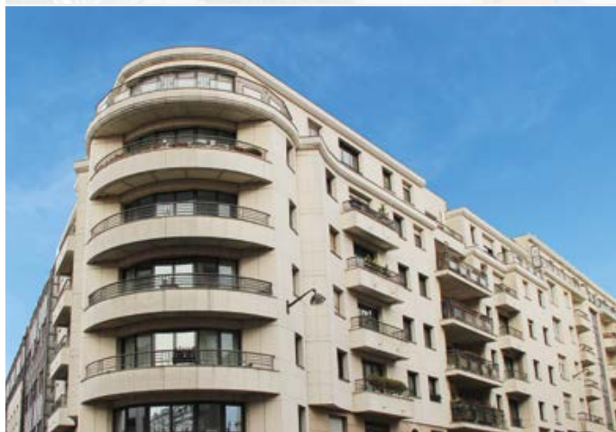
190 RUE CHAMPIONNET - PARIS 18 Sale & Lease Back d'un immeuble de bureaux de 5 460 m 2 de CHAUVIN ARNOUX à LA FRANCAISE REM