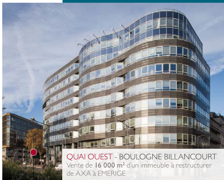
QUAI OUEST - BOULOGNE BILLANCOURT

Vente de 16 000 m 2 d'un immeuble à restructurer de AXA à EMERIGE