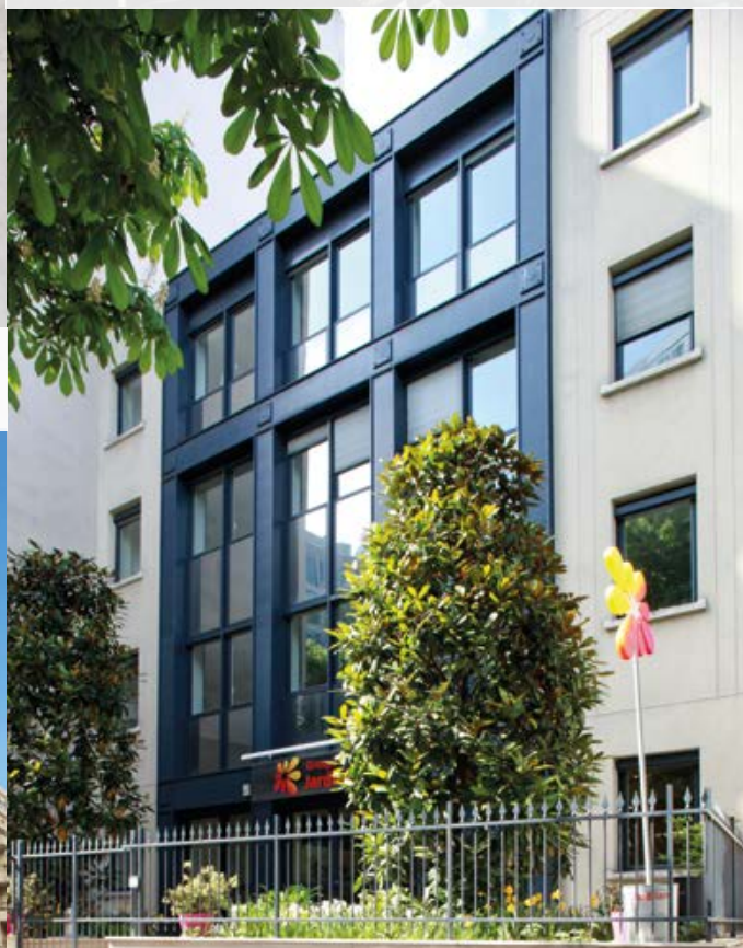
76 BOULEVARD PASTEUR - PARIS 15 Vente de 1 350 m 2 de bureaux de COVEA à VIVERIS