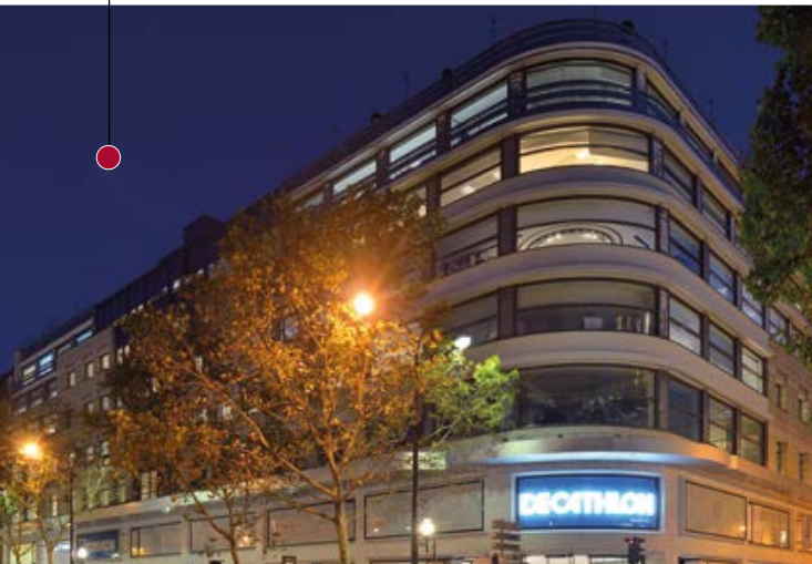
LE MADELEINE - PARIS I Vente de 30 000 m 2 de BLACKROCK à NORGES