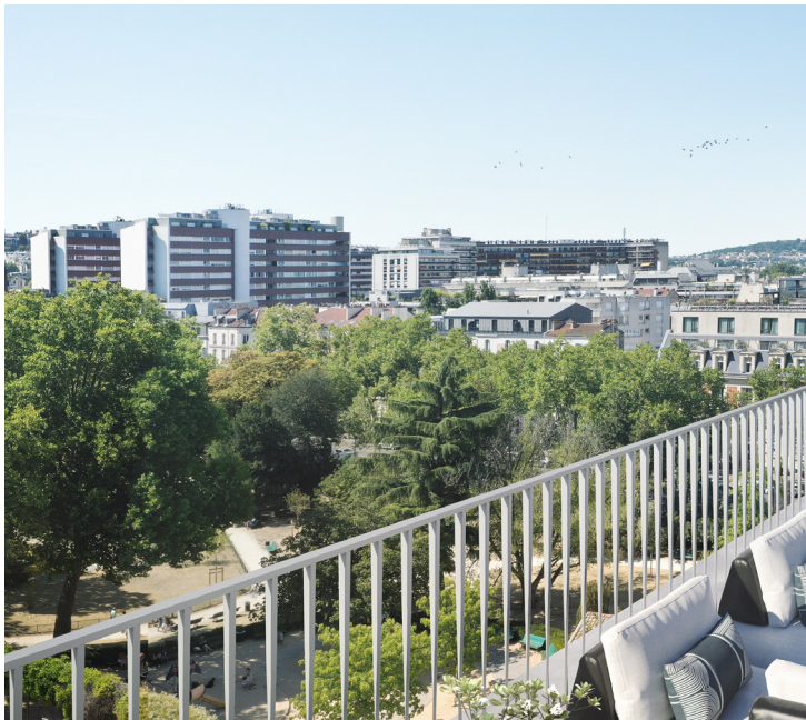
PASSAGE CHATEAUDUN - BOULOGNE-BILLANCOURT (92) Vente de 65 lots