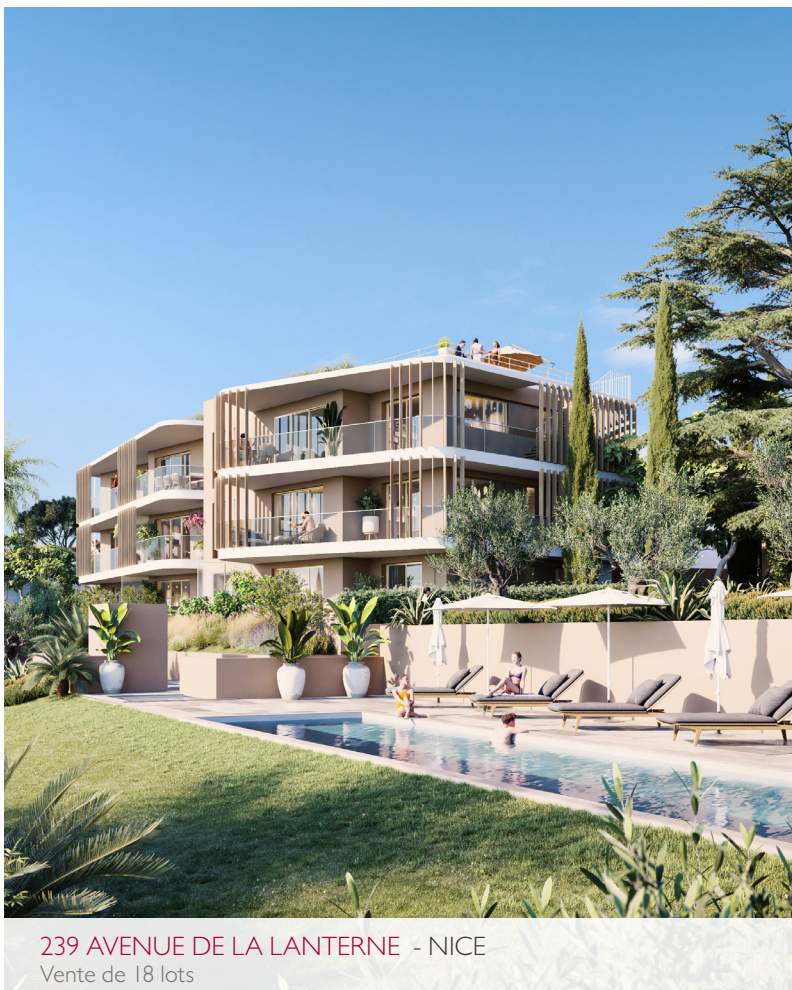
239 AVENUE DE LA LANTERNE - NICE Vente de 18 lots