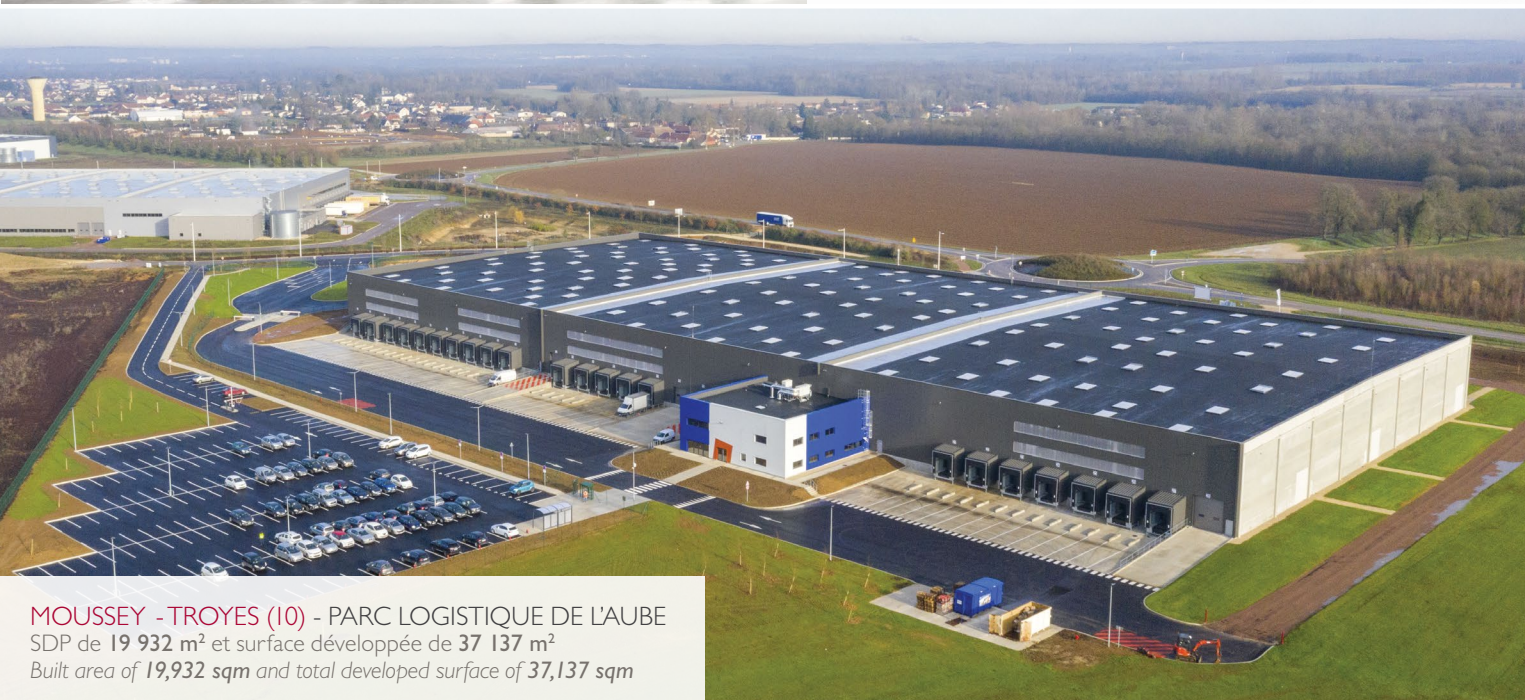
MOUSSEY - TROYES (10) - PARC LOGISTIQUE DE L'AUBE SDP de 19 932 m 2 et surface développée de 37 137 m 2 Built area of 19,932 sqm and total developed surface of 37,137 sqm

L'innovation, avec des bâtiments logistiques 4.0 Innovative 4.0 logistics buildings