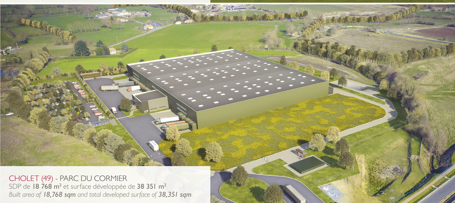
CHOLET (49) - PARC DU CORMIER SDP de 18 768 m 2 et surface développée de 38 351 m 2 Built area of 18,768 sqm and total developed surface of 38,351 sqm